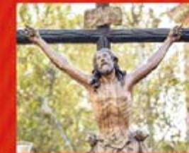
Stmo. Cristo de la Expiración