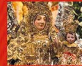
Ntra. Sra. de Consolación