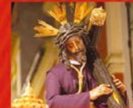
Ntra. P. Jesús del Gran Poder