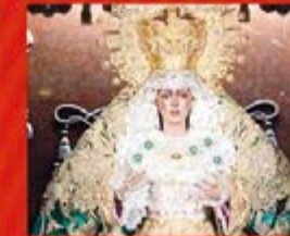
María Stma. Esperanza Macarena