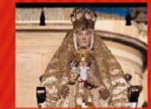
Ntra. Sra. de los Reyes