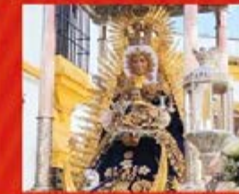
Ntra. Sra. de Setefilla