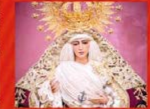
Ntra. Sra. Esperanza de Triana