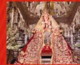
Ntra. Sra. de Valme